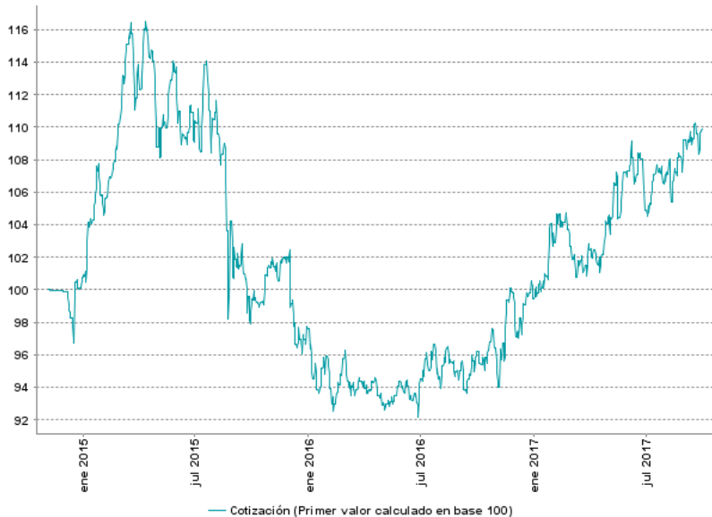
Cotización (Primer valor calculado en base 100)